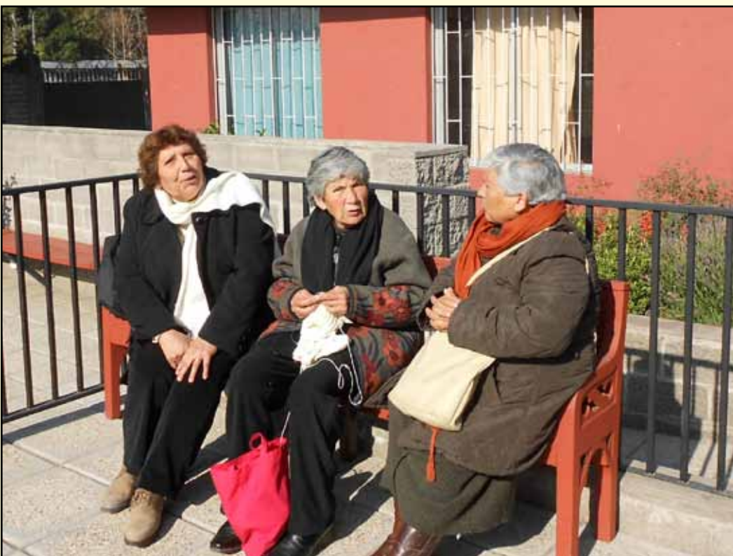
Vista general de las ponencias realizadas por las mañanas.