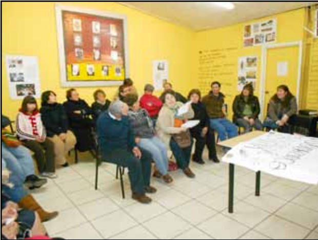
Vid estese nime nonsed quam nobisi dolore ex et ilique eliqui sit eius dolorec totatecte voluptatio voluptam qui quatio bea atur, officius.