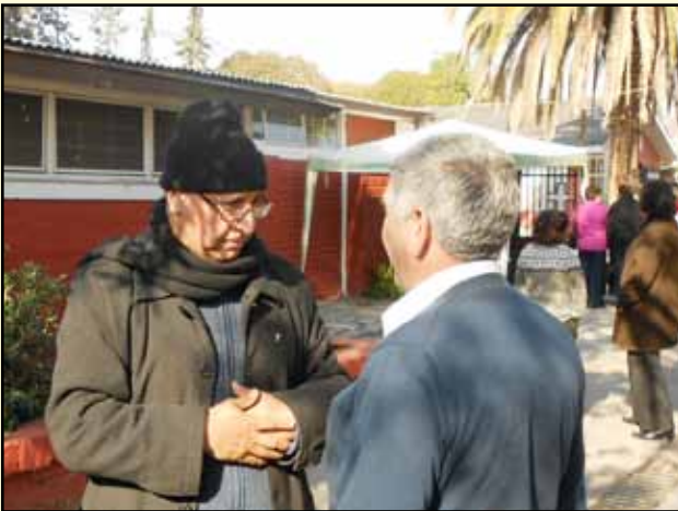
Doluptat esequo occulpa rchillo ipiente voluptamet ut veliquati officid