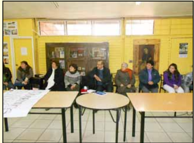
Ut aliquo num eatasi occati bernam aut vid et arum ne estis aces